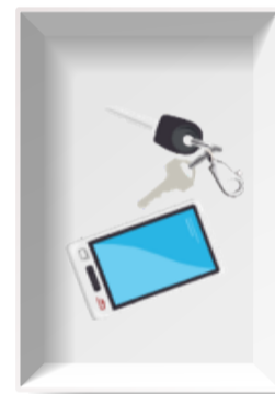
Alcohol no menos de 70%.