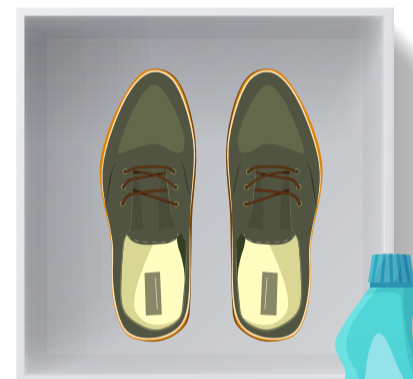
Solución de lejía.